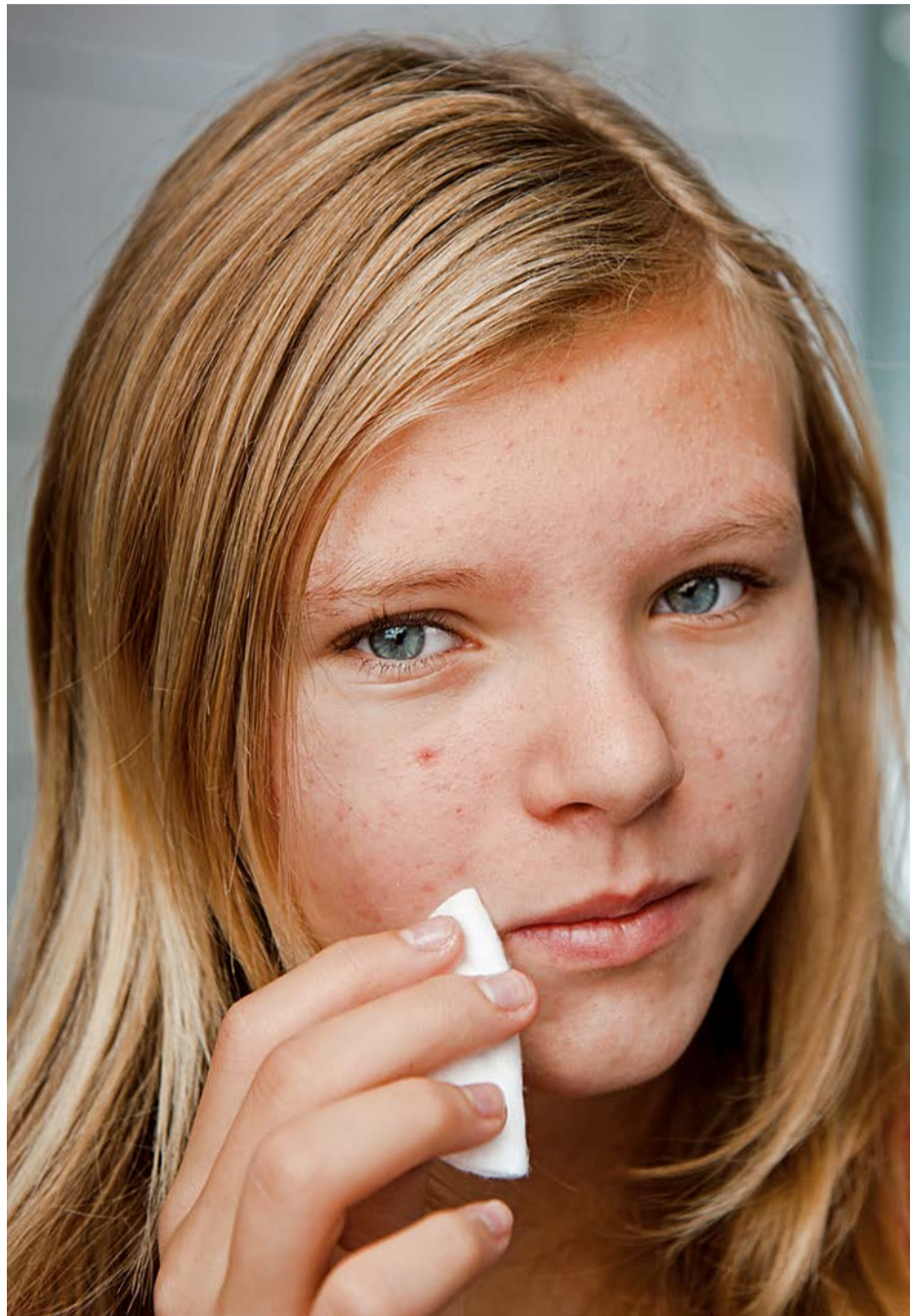
Mädchen in der Pubertät leiden sehr unter einer „unreinen“ Gesichtshaut.

Selten kann einer Hyperandrogenämie auch ein Defekt der 3-beta-Hydroxysteroid-Dehydrogenase zugrunde liegen. Dieses Enzym ist für die Verstoffwechslung von Pregnenolon, 17-OH-Pregnenolon und DHEA zuständig, weswegen diese Hormone vermehrt anfal-